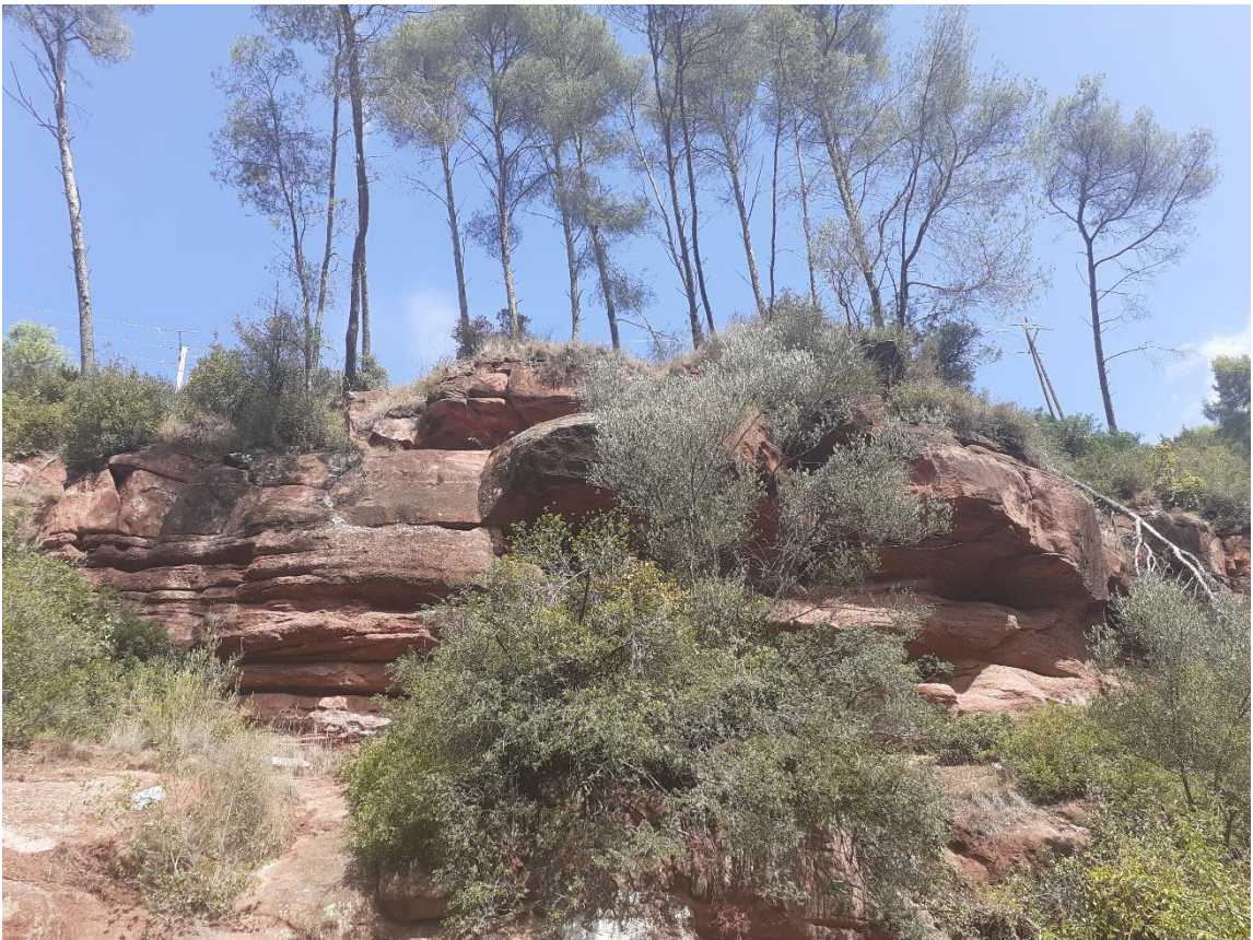
Los Gorgs de la Mola de Corbera de Llobregat